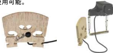
V-03 /¥22,000 ピックアップ本体のみ V-03 Pro2 /¥30,800 RJA+ジャック+ボリュームコントロール付き

高級メイプル材の駒に組み込まれたピックアップによって、レンジの広いクリアなサウンドを実現。音の太さを誇張するような他のピックアップと違い、バイオリン自体が持っている全てを引き出し、シンプルかつ最高の音を実現します。4/4フルサイズのバイオリンに使用可能。