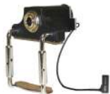
VVM-2 Pro2 /¥30,800 RJA+ジャック+ボリュームコントロール付き