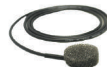
EP-01 /¥3,960 汎用ピエゾ・ピックアップ(ジャック又はプラグは別売り) EP-01J /¥6,050 汎用ピエゾ・ピックアップ+エンドピンジャック

楽器のサウンドボードに貼り付けて使用する高出力タイプの汎用型コンタクト ピックアップ。45cmのシールドコード付き。 ※大規模なステージでの使用は想定して設計しておりません。