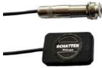
Dualie-Inside'R /¥12,100 内部取り付け用/エンドピンジャック付き