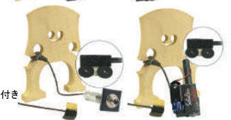
RB-2 /¥33,000 パッシブピックアップ/ アウトプットジャック・スラップセンサー+2コントロール付き RB-2A /¥45,100 アクティヴピックアップ/ アウトプットジャック・プリアンプ・スラップセンサー+2コントロール付き