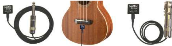
LP-15 Outsider /¥10,450 外部取り付け用/3mシールドケーブル+プラグ付き

LP-15は、薄い、小さい、軽いと3拍子揃ったサウンドボード・ピックアップです。厚さは約1.25mm、センサー部は2グラム未満と非常に軽量で、響板の動きや振動を妨げません。プリアンプを通さずに一般のギター／ベースアンプで良い音が出せるよう設計されています。