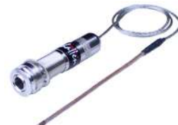
UST-1 /¥17,600 パッシブPU/エンドピンジャック付き