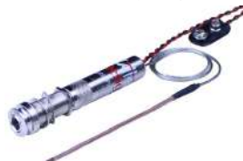
UST-1 Active /¥22,000 アクティブPU/エンドピンジャック・プリアンプ付き

お手軽なアンダーサドル式ピエゾ・ピックアップ。 直径1.9mmのピエゾケーブル素子を採用によって、サドルを少し削るだけで取り 付け可能。新開発のプリアンプ採用でリーズナブルな価格を実現し、バランスに 優れたリッチなサウンドが特長です。ローコストモデルのアコギも気軽にエレアコ に改造できます。 エンドピンジャック・プリアンプのゲイン・コントロールによって、0~20dBまで可変 が可能。(入力インピーダンス=2MΩ、出力インピーダンス=1KΩ) パッシブモデルは、外部のプリアンプを使用して下さい。