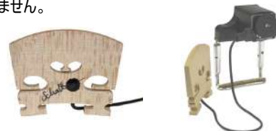
VR-2 /¥22,000 ピックアップ本体のみ VR-2 Pro2 /¥30,800 RJA+ジャック+ボリュームコントロール付き

ボトムエンド～ハイエンドまで、フル・レンジでスイートなレスポンス。高級メイプル材の駒にピエゾ素子が組み込まれているので、外れたり手間のかかるアジャストの必要がありません。