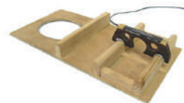
HFN-S2 /¥24,200 パッシブPU/エンドピンジャック付き HFN-S2 Artist /¥35,200 アクティブPU/エンドピンジャック・プリアンプ付き HFN-S2 Artist Plus 1 /¥37,400 アクティブPU/エンドピンジャック・プリアンプ+1コントロール(250K)付き HFN-S2 Artist Plus 2 /¥39,600 アクティブPU/エンドピンジャック・プリアンプ+2コントロール(250K)付き

Selmer/Maccaferriギター用ピックアップです。 ※FavinoスタイルやアリアMMシリーズには、マウント不可。