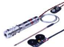
UST-1 Active VT /¥27,500 アクティブPU/エンドピンジャック・プリアンプ+2コントロール付き