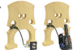
RB-1 /¥22,000 パッシブピックアップ/アウトプット・ジャック付き RB-1A /¥34,100 アクティヴピックアップ/アウトプットジャック・プリアンプ付き