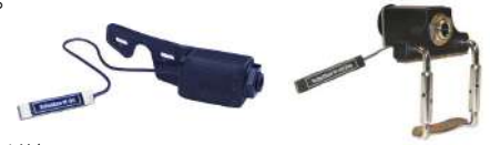
M-06 Neo /¥26,400 NEOジャック付き M-06 Pro /¥30,800 VJAジャック+ボリュームコントロール付き

楽器のブリッジに付属の両面テープで貼り付けるだけで楽器への加工は必要がなく、ジャックも楽器のテールピースに簡単に取り付けできます。クリアでクリーンな音色を実現。ピックアップは小型で軽量なため、楽器の生音への影響もありません。