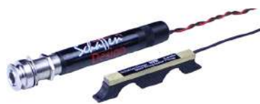
HFN Artist /¥35,200 アクティブPU/エンドピンジャック・プリアンプ付き

空気感ある“エアリー”なナチュラルサウンドを実現。 付属の両面テープ又はパテでギター内部のブリッジの下に貼り付けるだけ！ 穴あけ加工はエンドピン・ジャック用だけなので、15分もあれば取り付け完了。 ピックアップはウッド材による土台にノイズ対策のため軽量なプラス製のカバーが 付いており、7グラムと非常に軽量なため楽器の生音に影響を与えません。 パッシブモデルは、外部のプリアンプを使用して下さい。