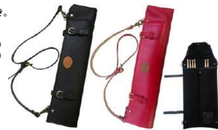
写真 左から LSB128BK ¥12,800 LSB128RD ¥12,800

野球のグラブにも採用されている牛革を使用した日本製レザースティックバッグ。新品時から柔らかな使用感が味わえ、使い込むに従ってさらに味がでます。 5Aスティックで最大5ペア収納可能。内部にはチューニングキーが収納できる小型ポケットを装備。 フロントタム着用用の革ひも付き。