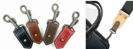
LSE20BLK ¥2,000 LSE20BRN ¥2,000 LSE20CHO ¥2,000 LSE20RED ¥2,000 ※いずれもベア入り

これは便利！！ギターストラップをショルダーストラップに変身させる変換コネクター！ このストラップ変換コネクターを使えば、お気に入りのギターストラップがカバンなどのショルダーストラップへ早変わり！ ギターストラップのエンドピン穴に変換コネクターの突起部分を通し、上から革へ口を留めるだけ。ショルダーストラップとして使用可能となります。 <意匠登録出願中>