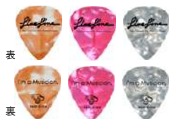
GP-1WM ホワイトパール/0.71mm ¥100 LGP-1WH ホワイトパール/0.96mm ¥100 LGP-10M オレンジパール/0.71mm ¥100 LGP-10H オレンジパール/0.96mm ¥100 LGP-1PM ピンクパール/0.71mm ¥100 LGP-1PH ピンクパール/0.96mm ¥100

ライブラインとIn Tune GPのコラボレーションによるギターピック。プレミアムクオリティーのセルロイドを採用したアメリカ製ピックです。