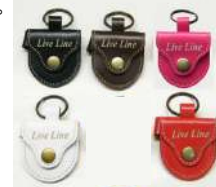
写真上段 左から LPC1200BK ¥1,200 LPC1200CH ¥1,200 LPC1200PK ¥1,200 写真下段 左から LPC1200WH ¥1,200 LPC1200RD ¥1,200

レザーピックケースが、新色も加わりモデルチェンジ！お洒落な小物入れとしても使えます！！ バッグにも使われているソフト牛革を採用し、より使いやすくなりました。50～60mm幅ストラップに装着可能なピックケースとしてはもちろん、コインケースや小物入れとしても使える優れモノ。 リング装備でキーホルダーにもなり、使い方はあなた次第です。さり気なく施されたステッチもポイント！