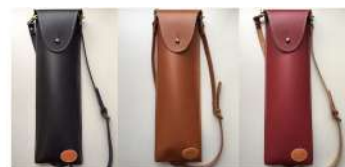
写真 左から LSB90BK ¥9,000 LSB90CM ¥9,000 LSB90RD ¥9,000

ハンドクラフトによるシンプルなレザースティックバッグで、良質牛革は使い込むほどに特有の味わいが出てきます。ショルダーストラップの片側をボトムリングに引っ掛ければ、ポチーバッグスタイルで携帯可能。オールレザーでこの品質、しかも日本製でこの価格は見逃せません！ 5Aスティックなら、4～5ペア収納可能。