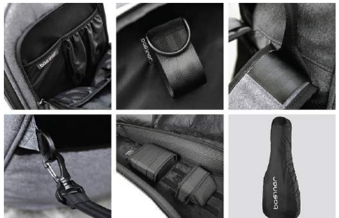
Tenor ACME-TU-CG Charcoal Grey オープンブライス JAN#4712914180490 ACME-TU-MB Midnight Black オープンブライス JAN#4712914180605 ACME-TU-OB Ocean Blue オープンブライス JAN#4712914180513 ACME-TU-RB Rust Brown オープンブライス JAN#4712914180520