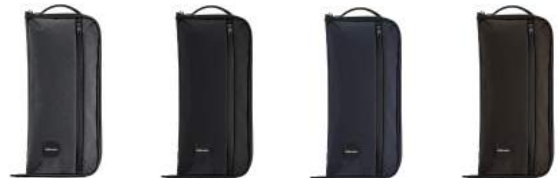
ACME-SB-CG Charcoal Grey ¥11,000 JAN#4712914180377 ACME-SB-MB Midnight Black ¥11,000 JAN#4712914180612 ACME-SB-OB Ocean Blue ¥11,000 JAN#4712914180391 ACME-SB-RB Rust Brown ¥11,000 JAN#4712914180407