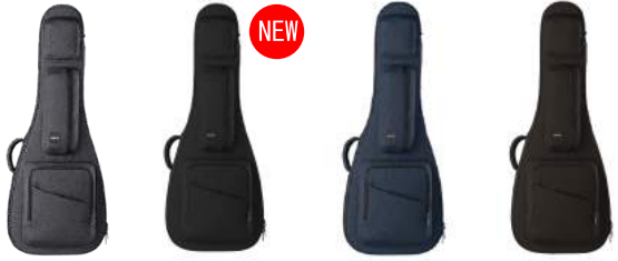
ACME-EG-CG Charcoal Grey オープンブライス JAN#4712914180179 ACME-EG-MB Midnight Black オープンブライス JAN#4712914180537 ACME-EG-OB Ocean Blue オープンブライス JAN#4712914180193 ACME-EG-RB Rust Brown オープンブライス JAN#4712914180209