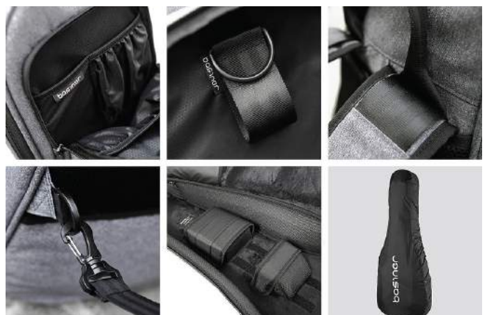
Tenor ACME-TU-CG Charcoal Grey オープンブライス JAN#4712914180490 ACME-TU-MB Midnight Black オープンブライス JAN#4712914180513 ACME-TU-OB Ocean Blue オープンブライス JAN#4712914180520 ACME-TU-RB Rust Brown オープンブライス JAN#4712914180605