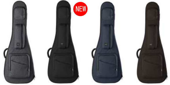
ACME-EB-CG Charcoal Grey オープンブライス JAN#4712914180216 ACME-EB-MB Midnight Black オープンブライス JAN#4712914180544 ACME-EB-OB Ocean Blue オープンブライス JAN#4712914180230 ACME-EB-RB Rust Brown オープンブライス JAN#4712914180247