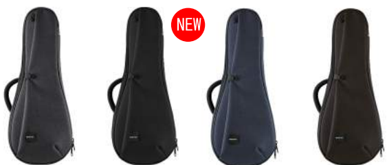
Concert/Soprano ACME-UK-CG Charcoal Grey オープンブライス JAN#4712914180339 ACME-UK-MB Midnight Black オープンブライス JAN#4712914180346 ACME-UK-OB Ocean Blue オープンブライス JAN#4712914180353 ACME-UK-RB Rust Brown オープンブライス JAN#4712914180360