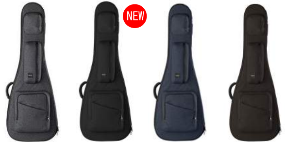
ACME-EB-CG Charcoal Grey オープンブライス JAN#4712914180032 ACME-EB-MB Midnight Black オープンブライス JAN#4712914180544 ACME-EB-OB Ocean Blue オープンブライス JAN#4712914180063 ACME-EB-RB Rust Brown オープンブライス JAN#4712914180247