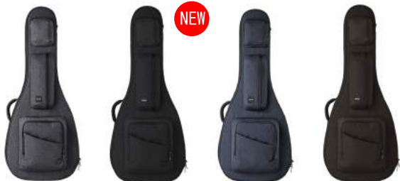
ACME-AC-CG Charcoal Grey オープンブライス JAN#4712914180070 ACME-AG-MB Midnight Black オープンブライス JAN#4712914180551 ACME-AC-OB Ocean Blue オープンブライス JAN#4712914180094 ACME-AC-RB Rust Brown オープンブライス JAN#4712914180285