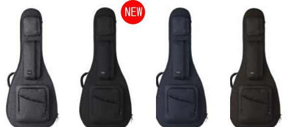
ACME-SH-CG Charcoal Grey オープンブライス JAN#4712914180292 ACME-SH-MB Midnight Black オープンブライス JAN#4712914180568 ACME-SH-OB Ocean Blue オープンブライス JAN#4712914180315 ACME-SH-RB Rust Brown オープンブライス JAN#4712914180322