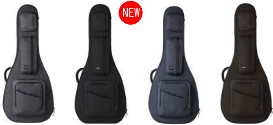
ACME-AC-CG Charcoal Grey オープンブライス JAN#4712914180254 ACME-AG-MB Midnight Black オープンブライス JAN#4712914180551 ACME-AC-OB Ocean Blue オープンブライス JAN#4712914180278 ACME-AC-RB Rust Brown オープンブライス JAN#4712914180285