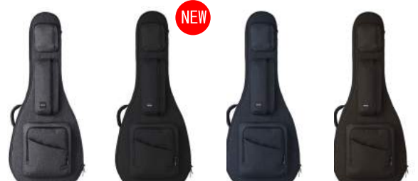
ACME-SH-CG Charcoal Grey オープンブライス JAN#4712914180100 ACME-SH-MB Midnight Black オープンブライス JAN#4712914180568 ACME-SH-OB Ocean Blue オープンブライス JAN#4712914180124 ACME-SH-RB Rust Brown オープンブライス JAN#4712914180322