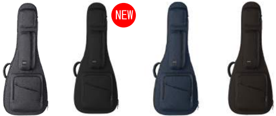
ACME-EG-CG Charcoal Grey オープンブライス JAN#4712914180018 ACME-EG-MB Midnight Black オープンブライス JAN#4712914180537 ACME-EG-OB Ocean Blue オープンブライス JAN#4712914180056 ACME-EG-RB Rust Brown オープンブライス JAN#4712914180209