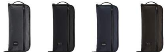
ACME-SB-CG Charcoal Grey ¥11,000 JAN#4712914180377 ACME-SB-MB Midnight Black ¥11,000 JAN#4712914180612 ACME-SB-OB Ocean Blue ¥11,000 JAN#4712914180391 ACME-SB-RB Rust Brown ¥11,000 JAN#4712914180407