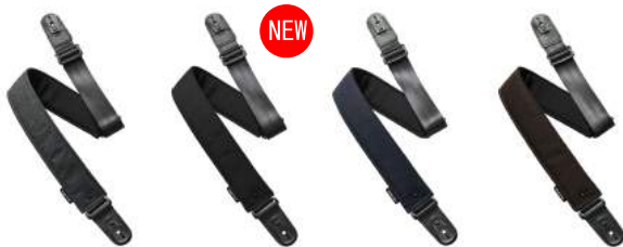
Regular Length ACME-ST-CG Charcoal Grey ¥6,800 JAN#4712914180131 101.6-127cm ACME-ST-MB Midnight Black ¥6,800 JAN#4712914180575 ACME-ST-OB Ocean Blue ¥6,800 JAN#4712914180155 ACME-ST-RB Rust Brown ¥6,800 JAN#4712914180162 Long Length ACME-STL-CG Charcoal Grey ¥6,900 JAN#4712914180452 119.4-149.9cm ACME-STL-MB Midnight Black ¥6,900 JAN#4712914180582 ACME-STL-OB Ocean Blue ¥6,900 JAN#4712914180476 ACME-STL-RB Rust Brown ¥6,900 JAN#4712914180483