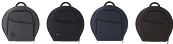
ACME-SN-CG Charcoal Grey ¥22,000 JAN#4712914180414 ACME-SN-MB Midnight Black ¥22,000 JAN#4712914180629 ACME-SN-OB Ocean Blue ¥22,000 JAN#4712914180438 ACME-SN-RB Rust Brown ¥22,000 JAN#4712914180445