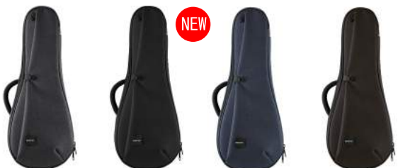
Concert/Soprano ACME-UK-CG Charcoal Grey オープンブライス JAN#4712914180339 ACME-UK-MB Midnight Black オープンブライス JAN#4712914180599 ACME-UK-OB Ocean Blue オープンブライス JAN#4712914180353 ACME-UK-RB Rust Brown オープンブライス JAN#4712914180360