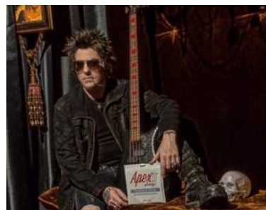
Rachel Bolan -Skid Row

【クライオジェニック処理とは】超低温の-196℃まで冷却し、その後常温に戻すことによって、金属分子配列の歪みを取り除いて完全な結晶体に整える技術です。この処理をおこなった金属は、分子構造に歪みがないことで電氣的抵抗が減少するうえ、強度および耐久性が格段に向上します。