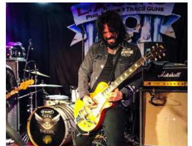
Tracii Guns -L.A. Guns

楕円状の巻弦によって、通常のワウンド弦と同じ芯線の長さ下でもよりタイトに多く巻け、高密度。